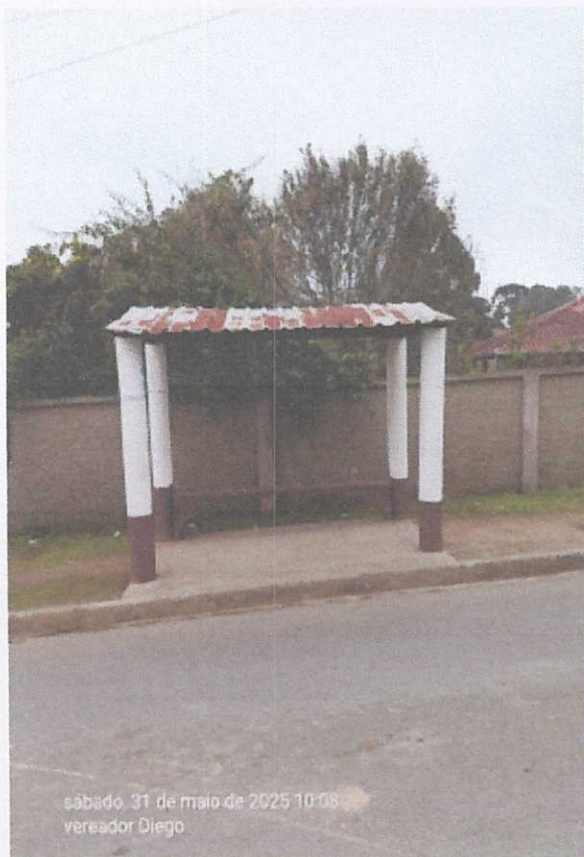
sábado, 31 de maio de 2025 10:08 vereador Diego