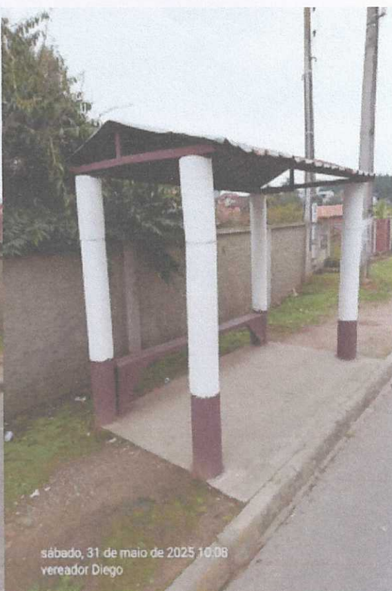
sábado, 31 de maio de 2025 10:08 vereador Diego