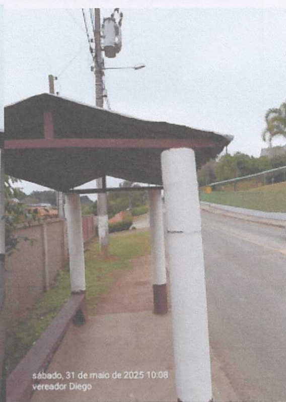
sábado, 31 de maio de 2025 10:08 vereador Diego