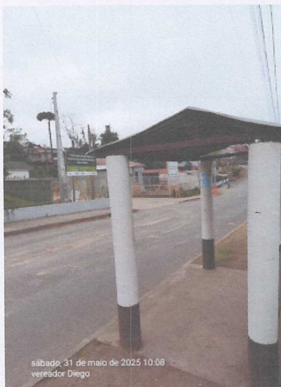
sábado, 31 de maio de 2025 10:08 vereador Diego