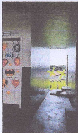
Portão com 900mm x 3000mm altura.