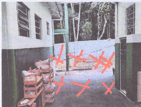
Grades com portão de 1000mm x 3000mm altura.